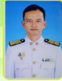
นายกณพ เกตุชาติ นายกเทศมนตรีนครนครศรีธรรมราช

นายกเทศมนตรีนครนครศรีธรรมราช แต่งตั้ง รองนายกเทศมนตรีนครนครศรีธรรมราช และ เลขานุการนายกเทศมนตรีนครนครศรีธรรมราช ตามคำสั่งเทศบาลนครนครศรีธรรมราช ที่ 1407/2564