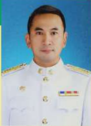
นายรัชวิษ ศรีสมานูwait